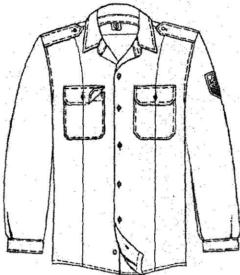
Фигура 1- Изглед предна част

Знакът за принадлежност към БА, „Наръкавна жакардова емблема “БА“ според род войска, се пришива на левия ръкав, при разгънато положение по основния детайл. Центроването е по линия срещуположна на съединителния шев на ръкава, на разстояние 10,0 cm от горната част на емблемата до съединителния шев, прикачащ ръкава.