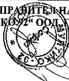
ИЛИЯН ДИМИТРОВ ПЕТРОВ